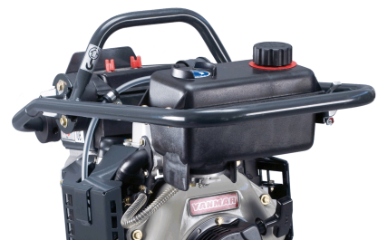
Manipulation aisée Volant à suspension