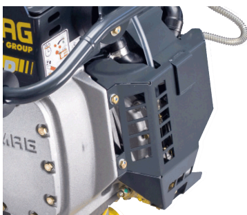
Longue durée de vie Protection intégrale du moteur